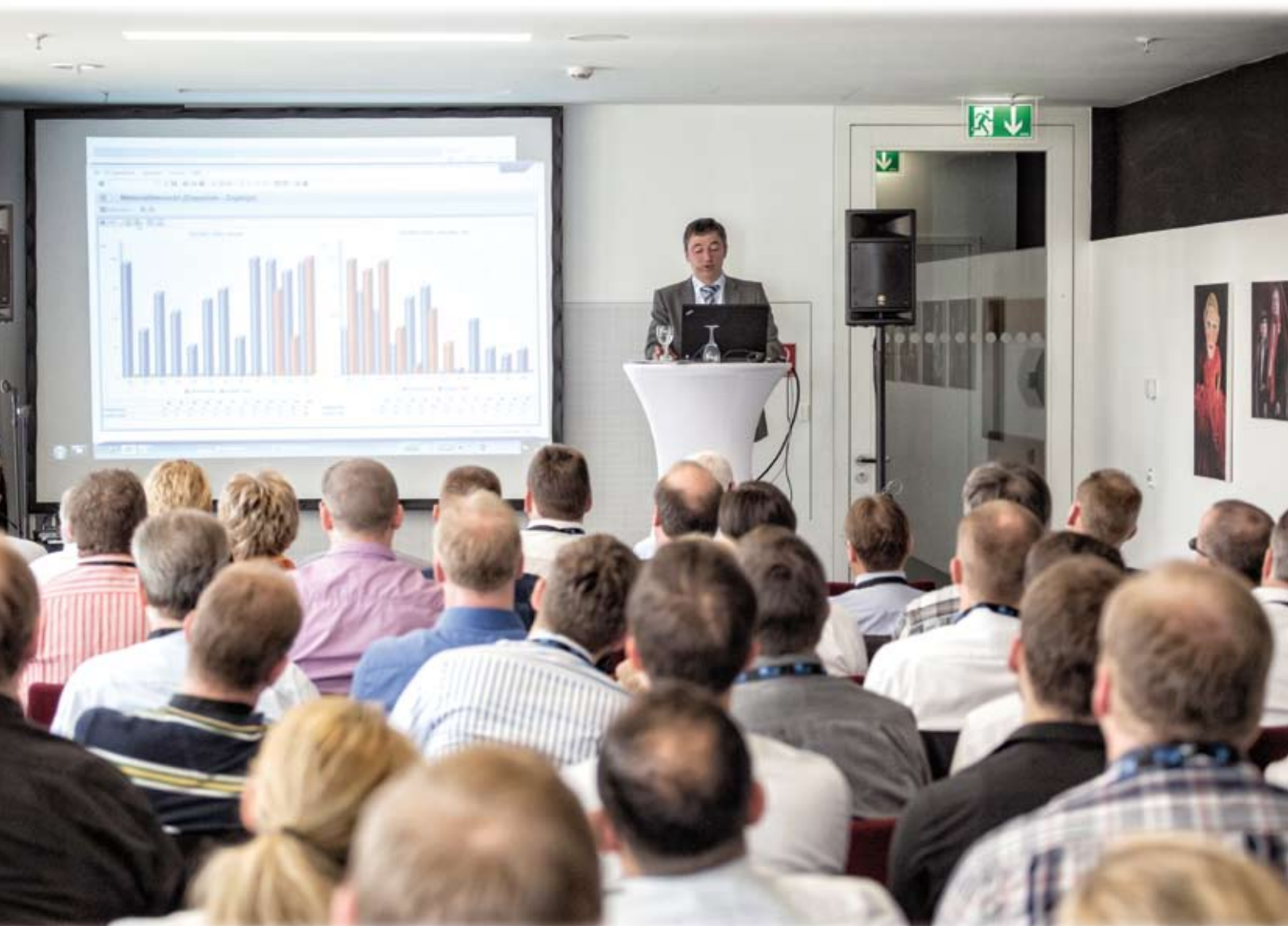
Die G.I.B Success Days – die zentrale Informationsquelle zu SAP-Logistik und ABAP-Programmierung.

Telefon: +49 271 890 38-0 Telefax: +49 271 890 38-99 Mail: info@gibmbh.de Online: www.gibmbh.de